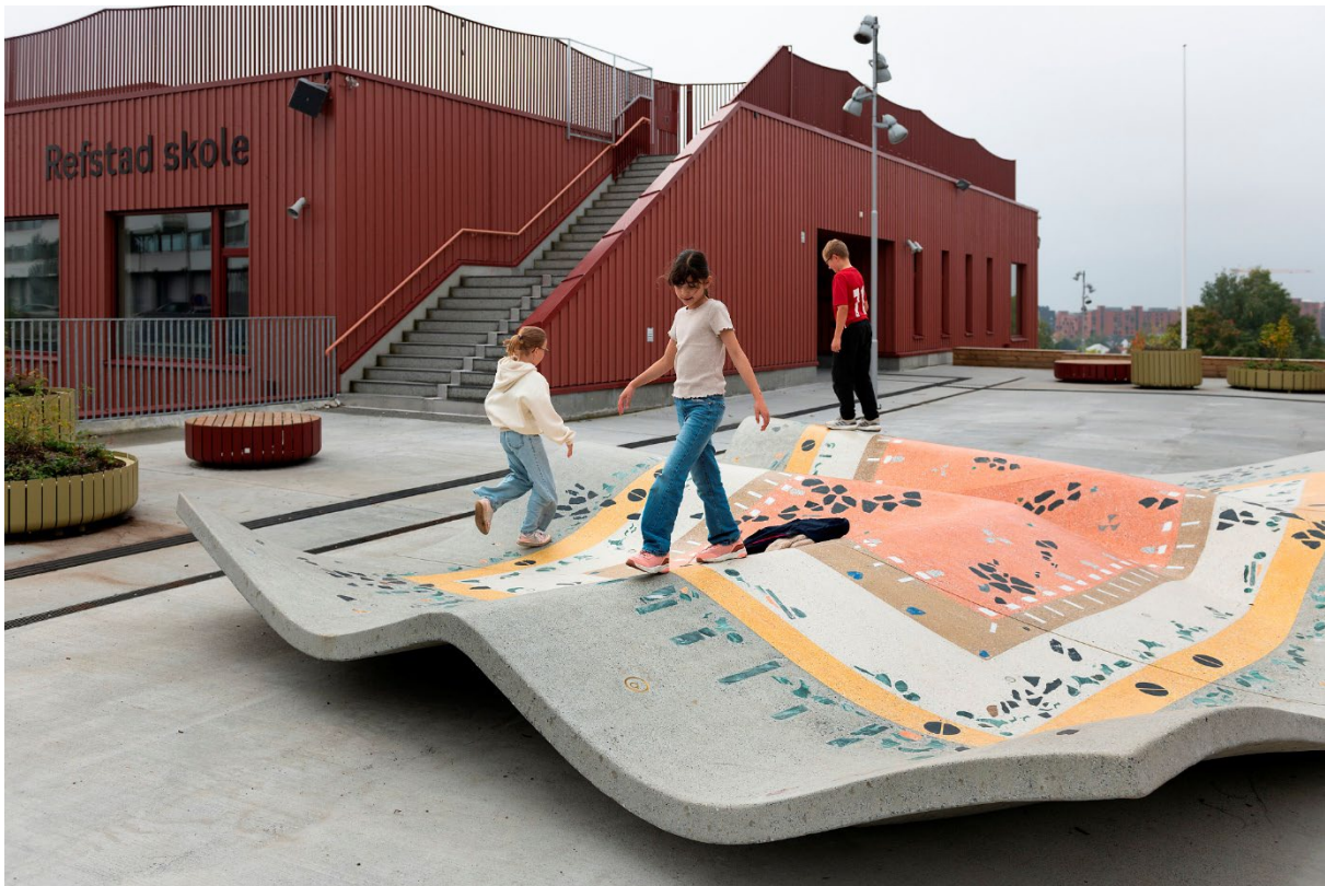
Viel Bjerkeset Andersen, Mellomlanding (2024) på Refstad skole. © Viel Bjerkeset Andersen / BONO.

I tillegg til å kjøpe eksisterende kunstverk, er vi en av Norges største oppdragsgivere for kunstnere. I Prosjektrummet har vi samlet fotodokumentasjon av et utvalg oppdrag vi har gitt til kunstnere i sammenheng med bygging eller rehabilitering av kommunale bygg. Dette er kunstverk som inngår som del av byggeprosjekter. I samme rom viser vi også eksempler på kunstprosjekter koblet til områdesatsinger, områdeløft og byutviklingsprosjekter.