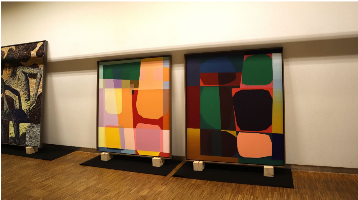
Montering av «En kunstsamling på vei» på Gamle Munch.

De aller fleste verkene som inngår i presentasjonen er kjøpt fra utstillinger i gallerier, offentlige visningssteder og kunstnerdrevne visningsrom. Etter at verkene er innlemmet i Oslo kommunes kunstsamling havner de bare unntaksvis på utstilling igjen. Vi kjøper kunst som plasseres der folk jobber og oppholder seg, det gjelder i første rekke kommunale virksomheter og arbeidsmiljøer. For oss er en utstilling i et museumsrom uvanlig. Vi velger derfor å ikke bruke betegnelsen utstilling om denne presentasjonen. Utstillingssalene er ikke den egentlige destinasjonen, de er kun et midlertidig oppholdsrom. Kunstverkene monteres derfor ikke på vanlig måte, men står oppstilt langs vegger, plassert i hyller og på paller, alle likestilte og klare for utplassering.